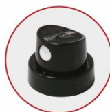
EROGATORE PRODOTTI VERNICIANTI NERO/BIANCO BLACK/WHITE PAINTING PRODUCTS ACTUATOR

Rompere il sigillo di sicurezza per aprire il tappo.