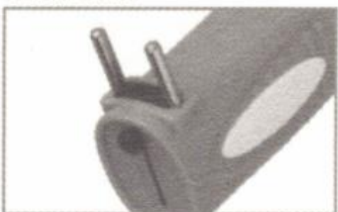
Spina di carica