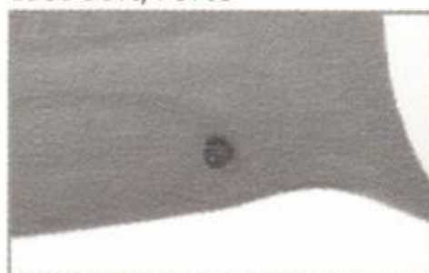
Indicatore di carica