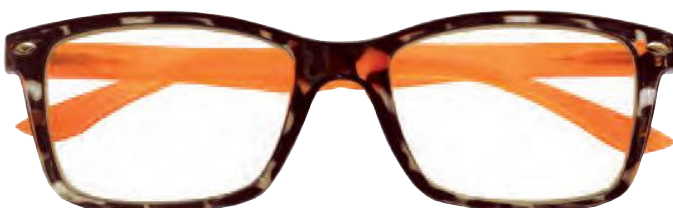
Mod. FASHION frontale colore tartaruga, aste arancio