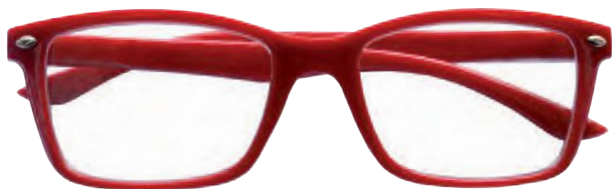
Mod. FASHION colore rosso, aste rosse