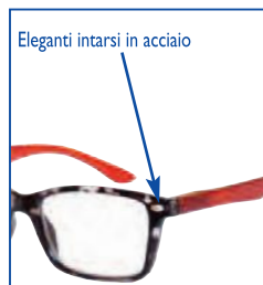
Eleganti intarsi in acciaio

L'esclusiva confezione regalo contiene anche l'astuccio in ecopelle.