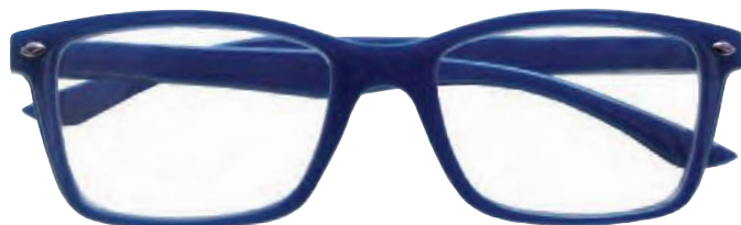
Mod. FASHION colore blu, aste blu