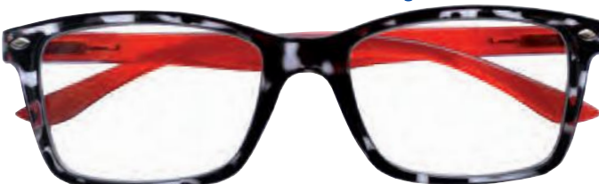
Mod. FASHION frontale colore tartaruga, aste rosse