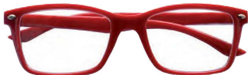
Mod. FASHION colore rosso, aste rosse