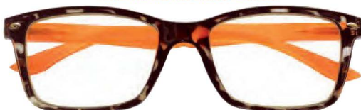
Mod. FASHION frontale colore tartaruga, aste arancio