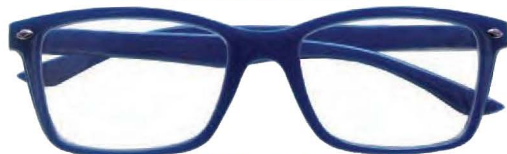
Mod. FASHION colore blu, aste blu