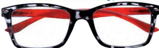
Mod. FASHION frontale colore tartaruga, aste rosse