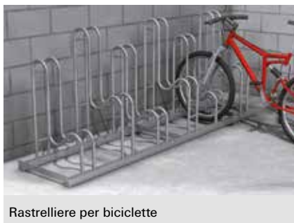
Rastrelliere per biciclette