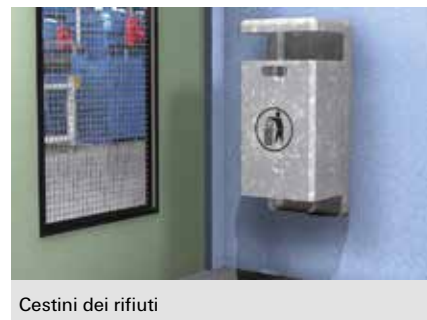
Cestini dei rifiuti