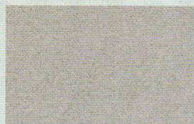
GRIGIO CHIARO (grana grossa)