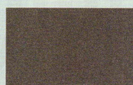
MARRONE (grana fine)