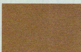
RAME (grana grossa)