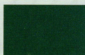
VERDE MUSCHIO (grana fine)