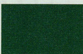
VERDE MUSCHIO (grana grossa)