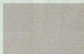
GRIGIO CHIARO (grana fine)