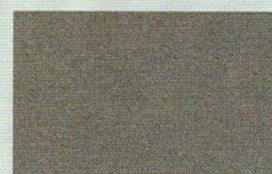
GRIGIO MEDIO (grana fine)