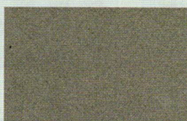
GRIGIO MEDIO (grana grossa)