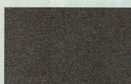
GRIGIO SCURO (grana fine)