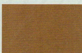
RAME (grana fine)